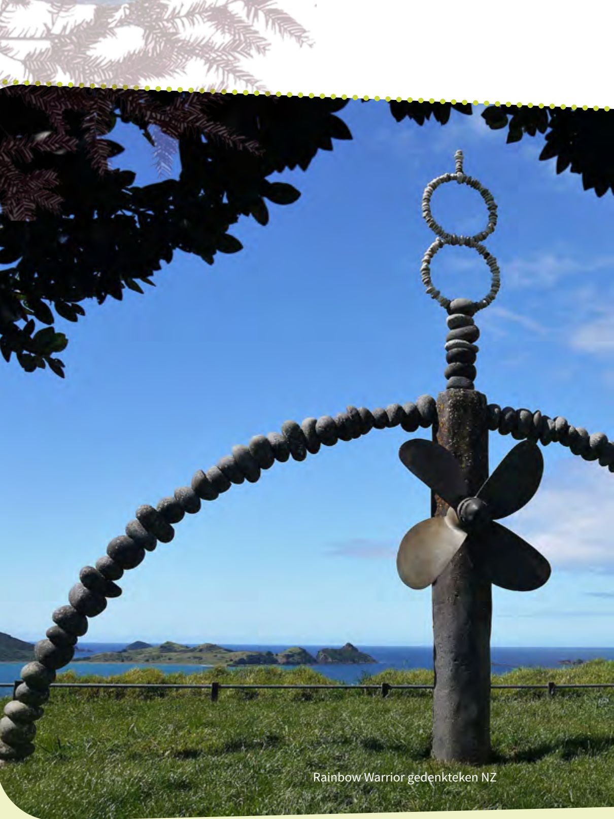
Rainbow Warrior gedenkteken NZ