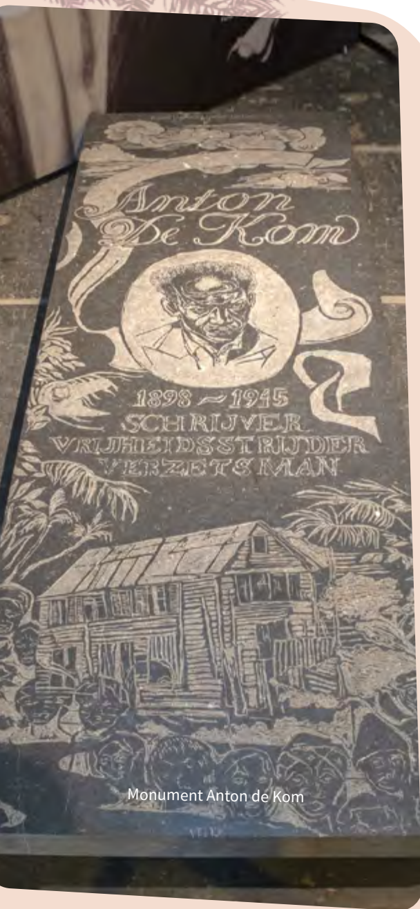
Monument Anton de Kom

begonnen hierop plantages voor thee, koffie, suiker en tabak. Om de plantages draaiend te houden werden er uiteindelijk koelies (contractarbeiders) uit Java, China en India, onder valse voorwendselen geronseld en tewerk gesteld op deze plantages.