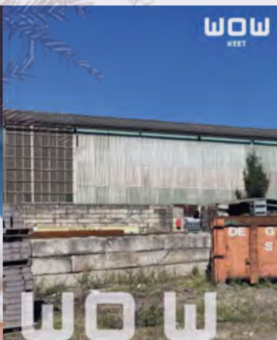
Industrieel erfgoed op de schop door studenten TU