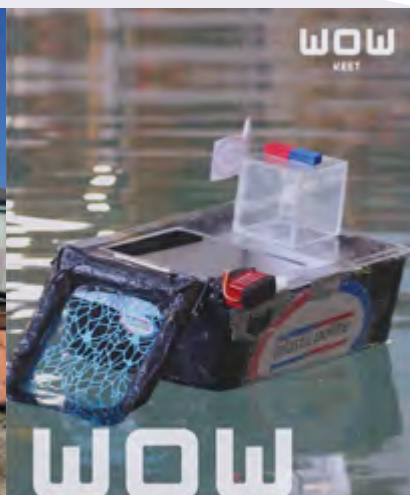
Leerlingen Dalton Lyceum Barendrecht winnen Clear Rivers Challenge