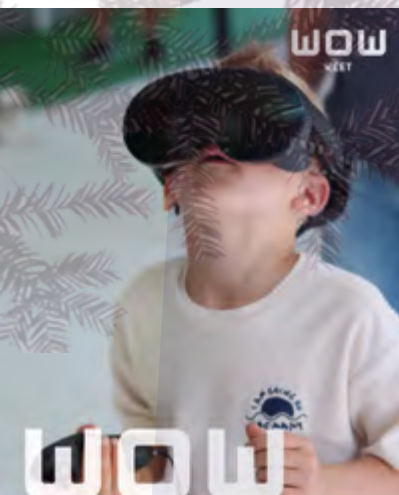
VRreality is realiteit in de WoWKeet